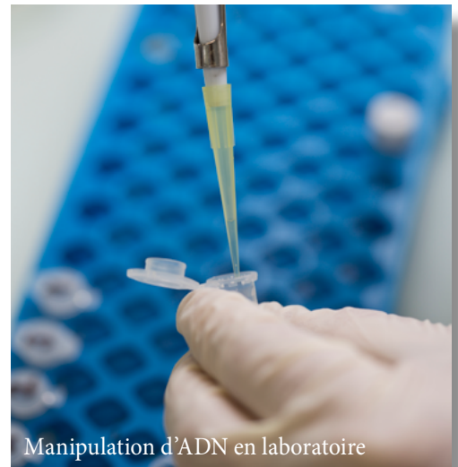
Manipulation d'ADN en laboratoire

Ces analyses sont également le moyen d'identifier de nouvelles caractéristiques génomiques d'une maladie. Elles représentent de nouvelles cibles potentielles permettant de développer les médicaments de demain. Ceci explique pourquoi on parle de traitement personnalisé.